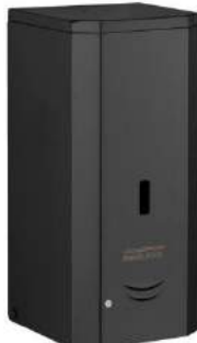
DJ0037AB Acabado negro mate