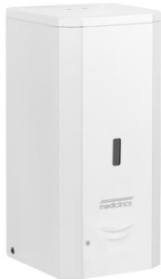
DJ0037A Acabado blanco