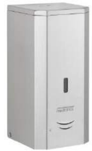
DJ0037ACS Acabado satinado