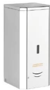
DJ0037AC acabado brillante